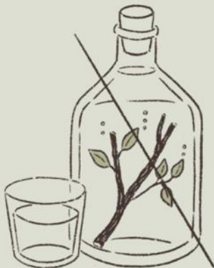
No wood infusion