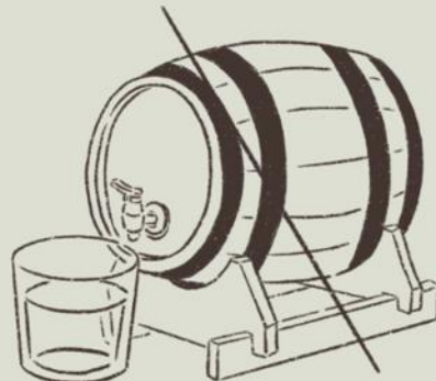
No wood maturation